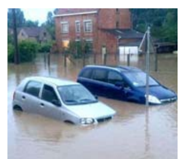
Le fonds indemniser.

Le gouvernement a finalisé le dossier des calamités publiques du mois de mai dernier en reconnaissant les orages violents et coulées des 27, 28 et 29 mai dans les communes de Merbes-le-Château, Assesse, Juprelle et Theux. Par ailleurs, l'IRM ayant validé définitivement ses données de précipitations journalières, le gouvernement a étendu la reconnaissance qu'il avait décidée le 7 juillet, concernant les pluies abondantes et inondations des 2 et 3 juin, aux communes de Nassogne, de Tenneville et de Rendu. La même démarche a été effectuée pour les orages du 5 juin : la reconnaissance comme calamité publique est accordée aux communes de Comblain-aux-Ponts, Herve, Juprelle en province de Liège, Manhay et Paliseul en province de Luxembourg et Mognignes dans le Hainaut.